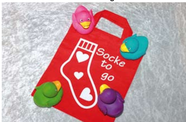
Tasche zum Sockenstricken unterwegs