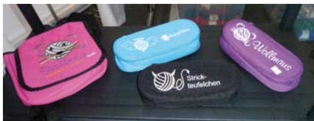
Umhängetasche und Nadeltäschchen

Bei uns gibt es jetzt auch T-Shirts, mit einer beschreibbaren Fläche – ideal für Kindergeburtstage und andere lustige Gelegenheiten. Einfach abwischen und mit Kreide kreativ neu gestalten.