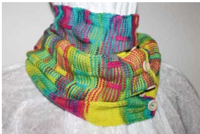
Schal mit Knöpfen aus unserer Wolle