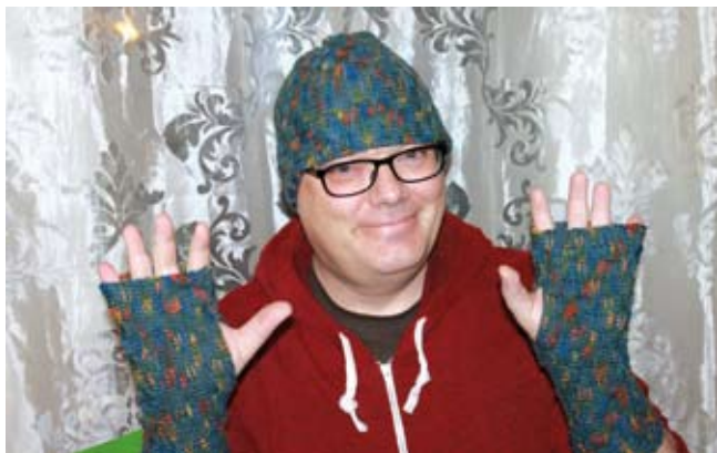
Bernd von wundervoll.biz