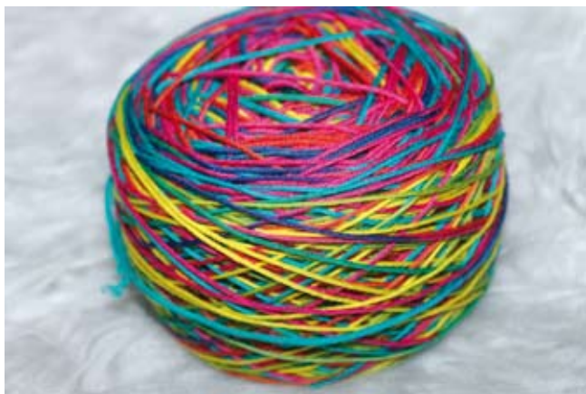
Handgefärbte Wolle – zum Knäuel gewickelt