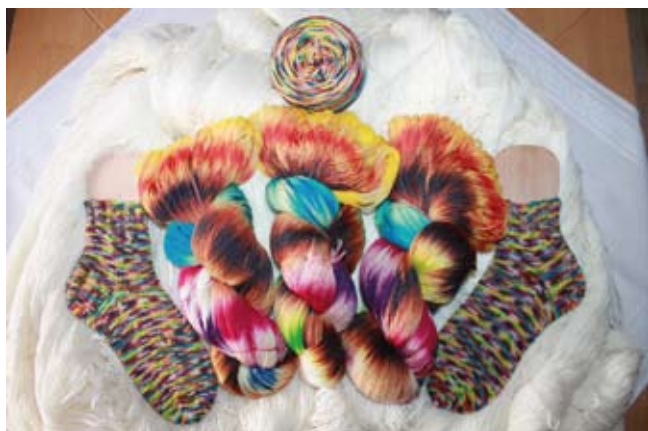
Vom Strang zum Knäuel und zur Socke