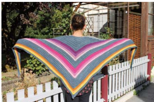
Margit zeigt ein schönes Dreieckstuch