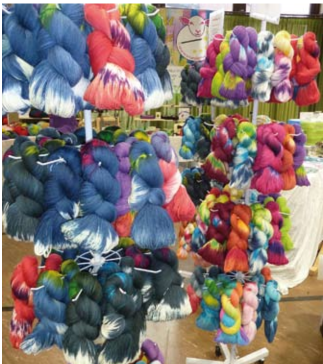
Unsere Wolle auf einem Wollmarkt