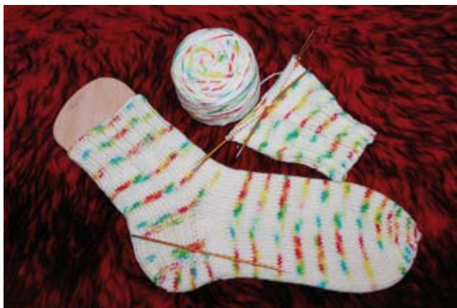
Socke aus handgefärbter Wolle